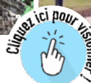
1: Inauguration de l'arboretum le “Bois de Wuwei”; 2: Plantation d'espèces endémiques; 3: Temple Guan Di Saint-Pierre; 4: Reportage de Réunion La 1ère sur l'inauguration du “Bois de Wuwei” du Temple Guan Di Saint-Pierre.