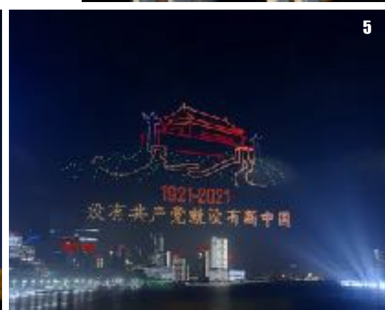
1: ; 2:  ; 3: ; 4:  ; 5:

Le 1er Juillet 2021, des dizaines de milliers de Chinois se sont retrouvés sur la place Tiananmen pour commémorer les 100 ans du Parti communiste: Défilés militaires, boulets de canon tirés dans les airs, gerbes colorées dans le ciel, chants, orchestres, sans oublier l'incontournable discours du Président XI Jinping. Bref, la Chine n'a pas lésiné sur les moyens pour marquer cet événement. À Shanghai, ville historique qui a vu naître le PCC en 1921 à l'époque où elle était encore divisée en concessions étrangères, un spectacle avant-gardiste fait de jeux de lumières est proposé et illumine le Bund.