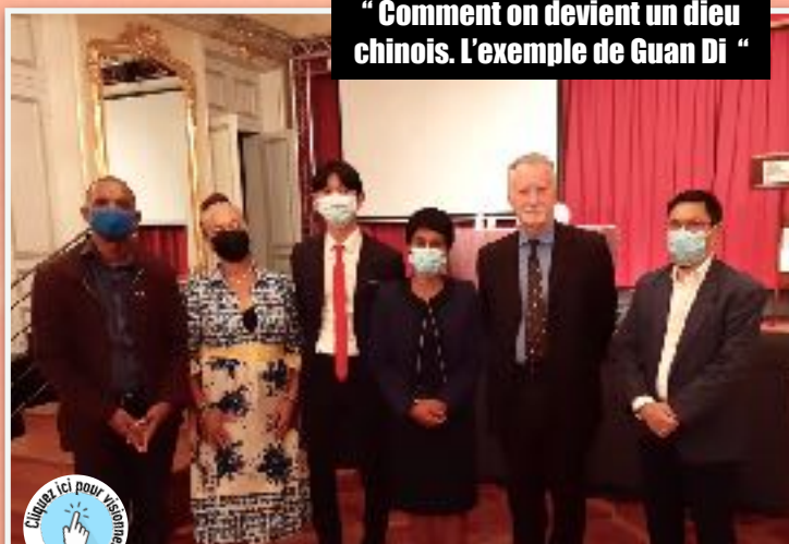
“ Comment on devient un dieu chinois. L'exemple de Guan Di “

Pour les curieux, cliquez sur les icônes bleues pour visionner les rediffusions des conférences :