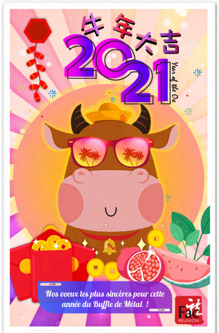
Image ci-dessus: Carte de vœux de la FAC Réunion “Bonne année du Buffle de Métal - 牛年大吉”